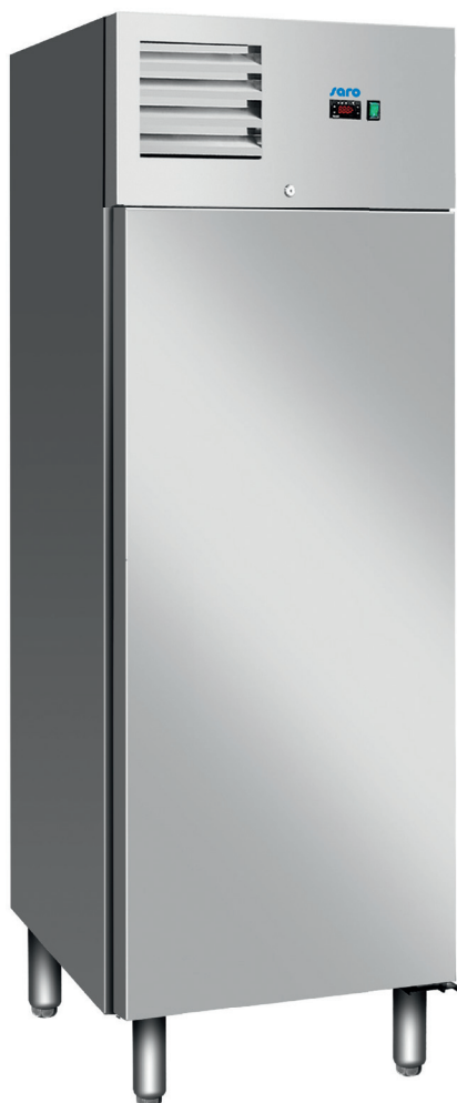
KYRA GN 700 BT