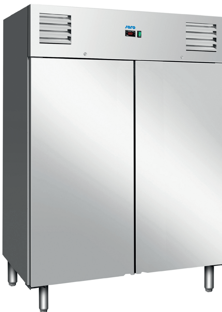
KYRA GN 1400 BT